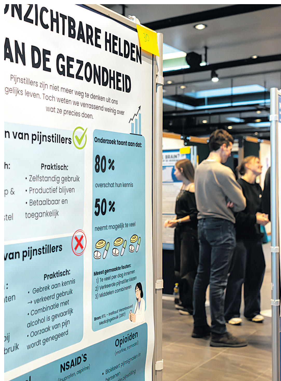
Scholieren presenteren hun zelfontworpen posters

“Aan de universiteit kies je namelijk voor een richting en niet per se een beroep”