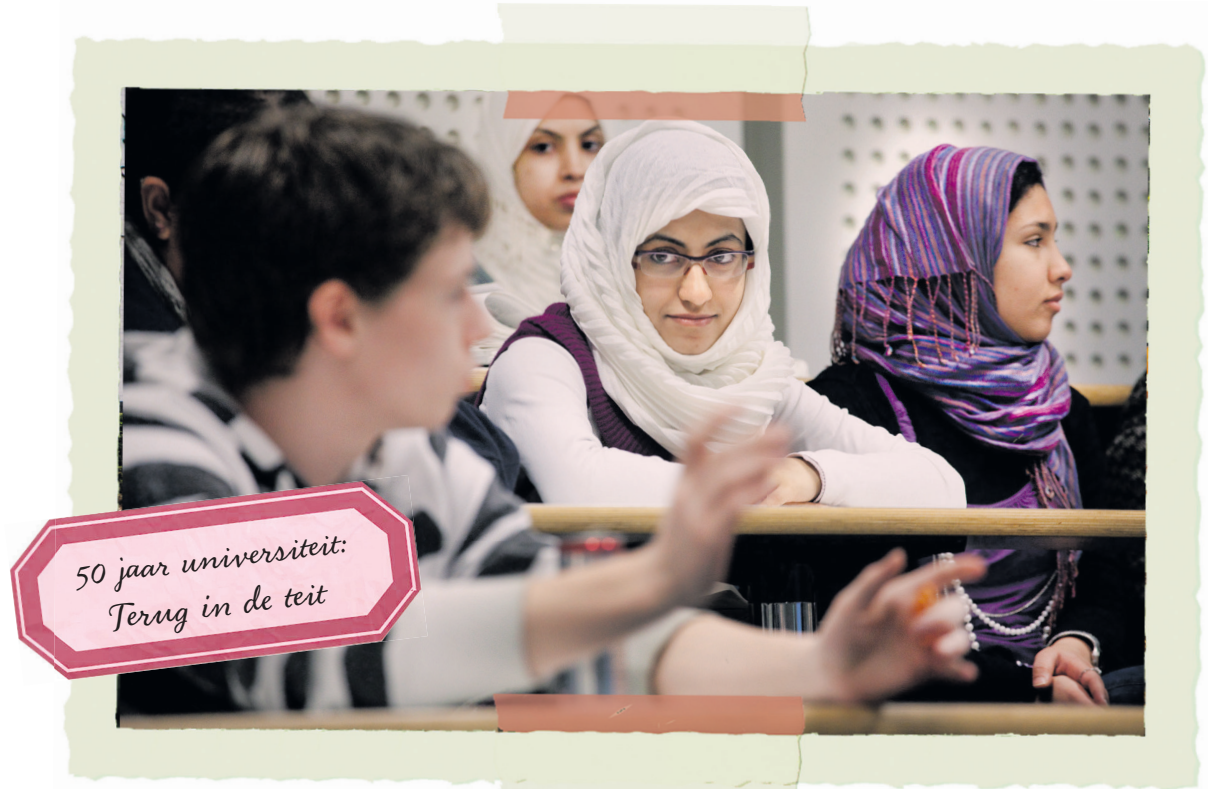
Geneeskunde studenten uit Saoedi-Arabië tijdens symposium